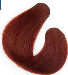
VELENCE VÖRÖS Венецианский рыжий Venecija crvena Benátkovo-červená