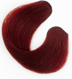
MAHAGONI Цвет красного дерева Mahagoni Mahagónová