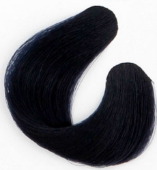
4X ZÖLD KORREKTOR Противо-рыжий Modifikovana crvena Modifikovaná zelená