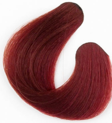
SÖTÉT TIZIAN VÖRÖS Темнорыжий, "Тизиан" Tamno tician crvena Ticianovo tmavo-červená