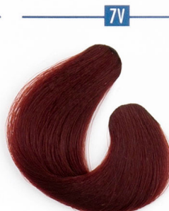
7V MÉLYVÖRÖS Темнорусый с глубоким рыжим оттенком Tamno crvena tamno plava Tmavočervená tmavoplavá