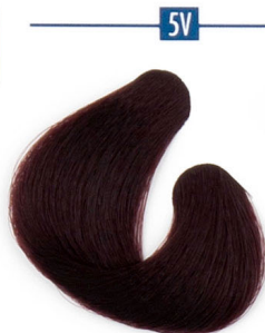
5V VIOLA VÖRÖS Светлофиолетовый каштановый Svetlo kesztenasta lila Svetlo-gaštanovo-fialová

Violet Фиолетовые цвета Lila boje Fialové farby