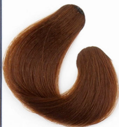
SÖTÉT DOHÁNY SZŐKE Темнорусый, с табачным оттенком Duvan tamno braun Tabakovo-tmavohneda