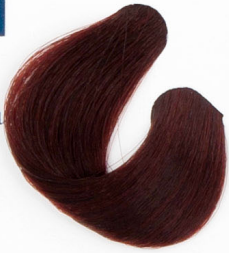
SÖTÉT MAHAGONI Тёмный цвет красного дерева Tamno mahagoni Tmavomahagónová