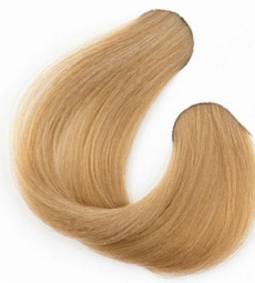
8G LEGVILÁGOSABB ARANY SZŐKE Ярко-золотисто русый Najsvetlija zlatnaplava Najsvetlejšia zlatoplavá