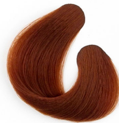
7R RÉZ MAHAGÓNI SZŐKE Прерко русый с оттенком красного дерева и меди Najsvetlija bronzanomahagoni plava Najsvetlejšia medeno-mahagónovo-plavá