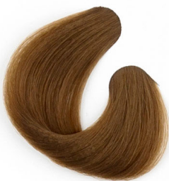
7G VILÁGOS ARANY SZŐKE Светло-золотисторусый Svetlo zlatnaplava Svetlá zlatoplavá