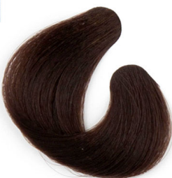
5G VILÁGOS ARANY BARNÁ Светло-золотисто каштановый Svetla zlatnobraun Svetlá zlatohnedá

Gold Золотистые цвета Zlatne boje Zlaté farby