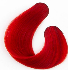
3X VÖRÖS KORREKTOR Рыжий Crvena Červená