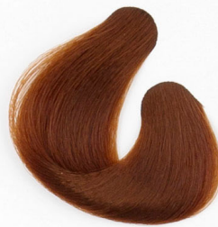
RÉZARANY Золотистый, с медным оттенком Bronzano zlatna Mosadzová