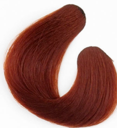
TŰZVÖRÖS Русый, огненно-рыжий Plava plamencrvena Plavá ohňovo-červená