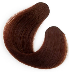
6R RÉZSZŐKE Русый с медным оттенком Bronzano plava Medenoplavá