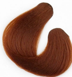
DOHÁNY SZŐKE Русый, с табачным оттенком Duvan plava Tabakovoplavá