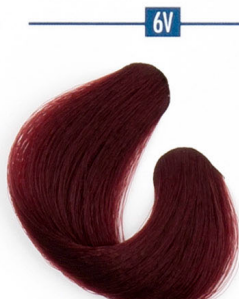
6V SZILVA VÖRÖS Рыжий с оттенком сливы Crvena šljiva Šljivkovo-červená