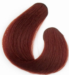
SÖTÉT VÖRÖS SZŐKE Золотисто-темно-рыже-русый Tamno bronzanocrvena plava Tmavomedená plavá