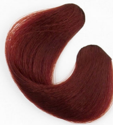
RÉZVÖRÖS SZŐKE Золотисто-рыже-русый Bronzanocrvena plava Červenomedená plavá