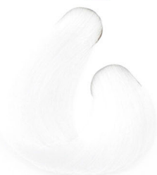
1X KIVILÁGOSÍTÓ Отбеливатель Super najsvetlija plava Osvetľovacia farba

Correctors Коррекционные препараты Korektori Opravovacie farby