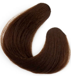
6G SÖTÉT ARANY SZŐKE Темно-золотисто русый Tamno zlatnaplava Tmavá zlatoplavá