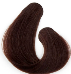
5R GESZTENYE RÉZ BARNÁ Светло-каштановый с медным оттенком Kesztenastobronzana svetlo braun Svetlá medenogaštanovohnedá

Copper Цвета с медным оттенком Bronzane boje Medené farby