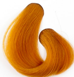
2X SÁRGA KORREKTOR Желтый Žuta Zlatá