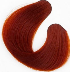
MAHAGONI VÖRÖS SZŐKE Русый, цвета красного дерева Mahagoni crveno plava Mahagónovo-červeno-plavá