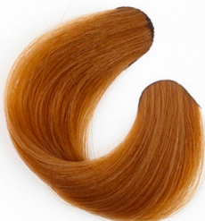
8R LEGVILÁGOSABB RÉZSZŐKE Прерко русый с оттенком меди Najsvetlija bronzano plava Svetlá medenoplavá